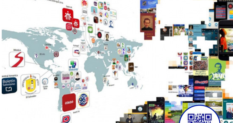
Salesians Apps in the World Salesians Apps available from 2013 to May 2016 The map shows salesians Apps in its original respective country. The size suggests quantity of downloads in Android until April 2016. Notes: iOS apps are not calculated.

para todos os gostos. De jogos, a eventos, passando pelas campanhas de solidariedade, são muitos os temas que estão na origem da criação de aplicações no universo salesiano. • InfoANS/Miguel Mendes