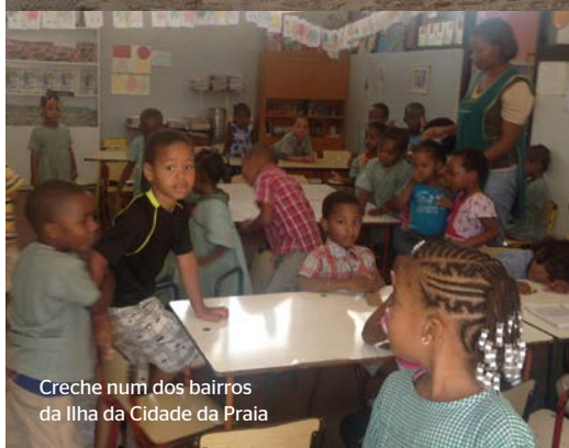
Creche num dos bairros da Ilha da Cidade da Praia