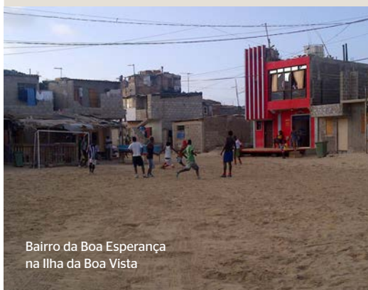
Bairro da Boa Esperança na Ilha da Boa Vista